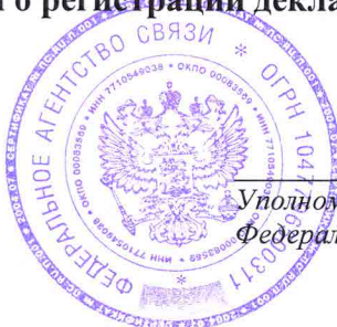
Уполномоченный представитель Федерального агентства связи